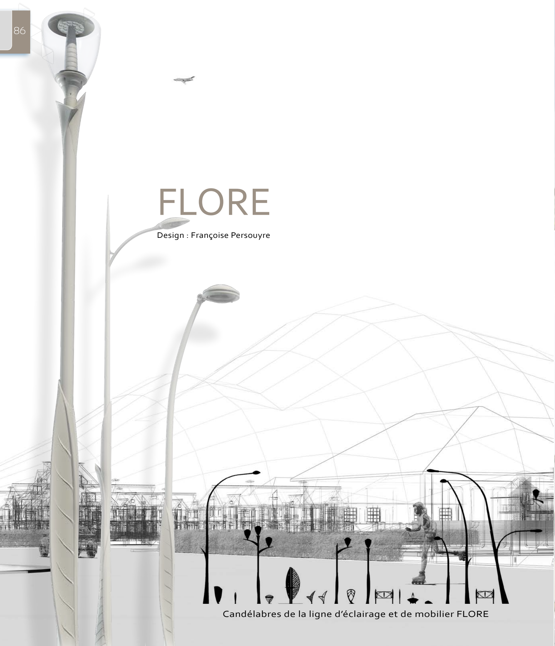
Candélabres de la ligne d'éclairage et de mobilier FLORE