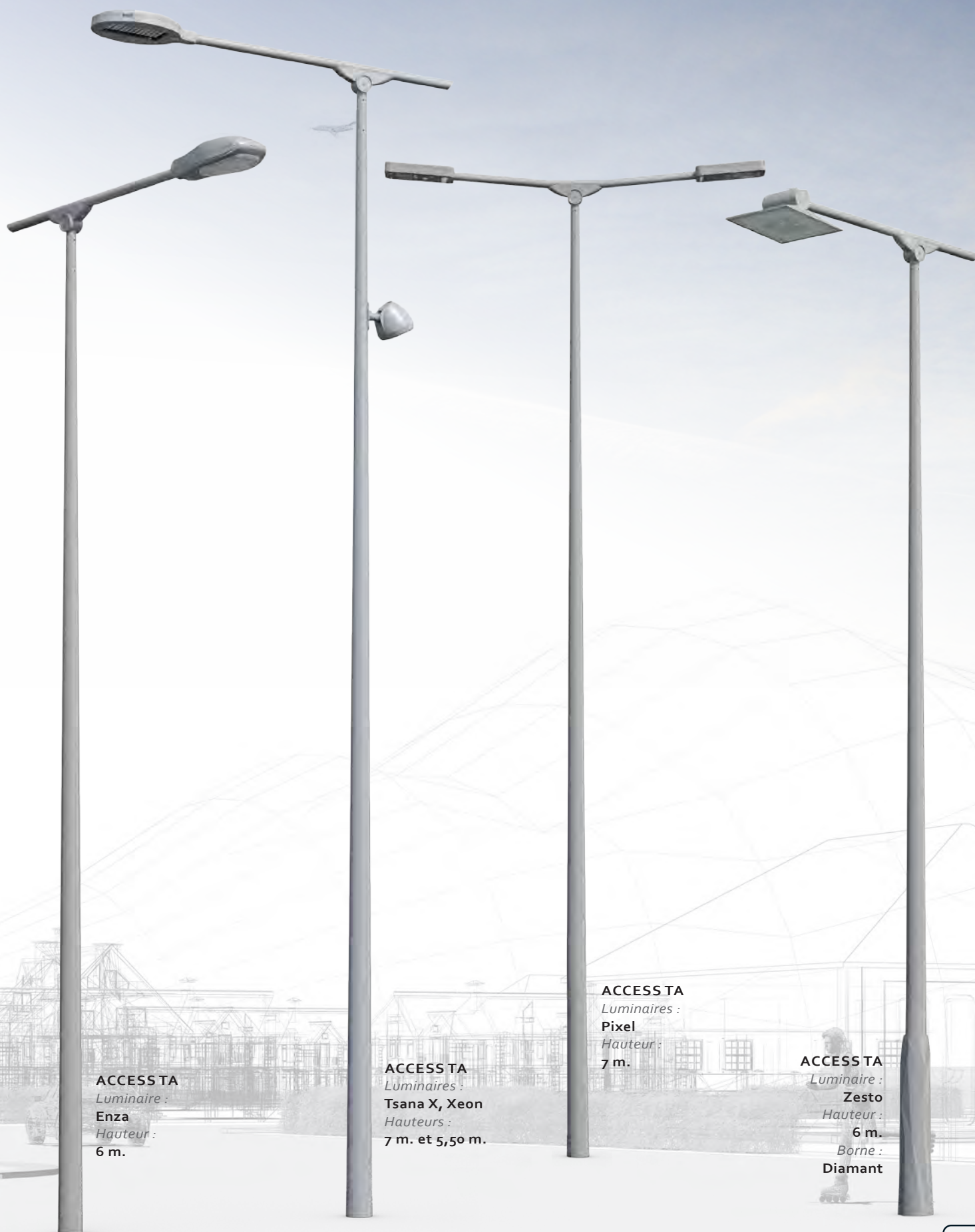
ACCESS TA Luminaire : Enza Hauteur : 6 m.