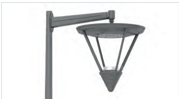
Elyxe Indigo suspendu