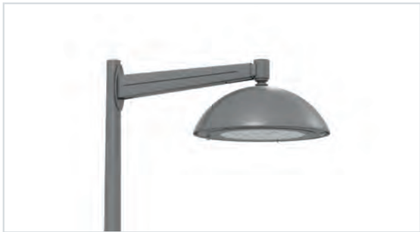
Metro Indigo suspendu